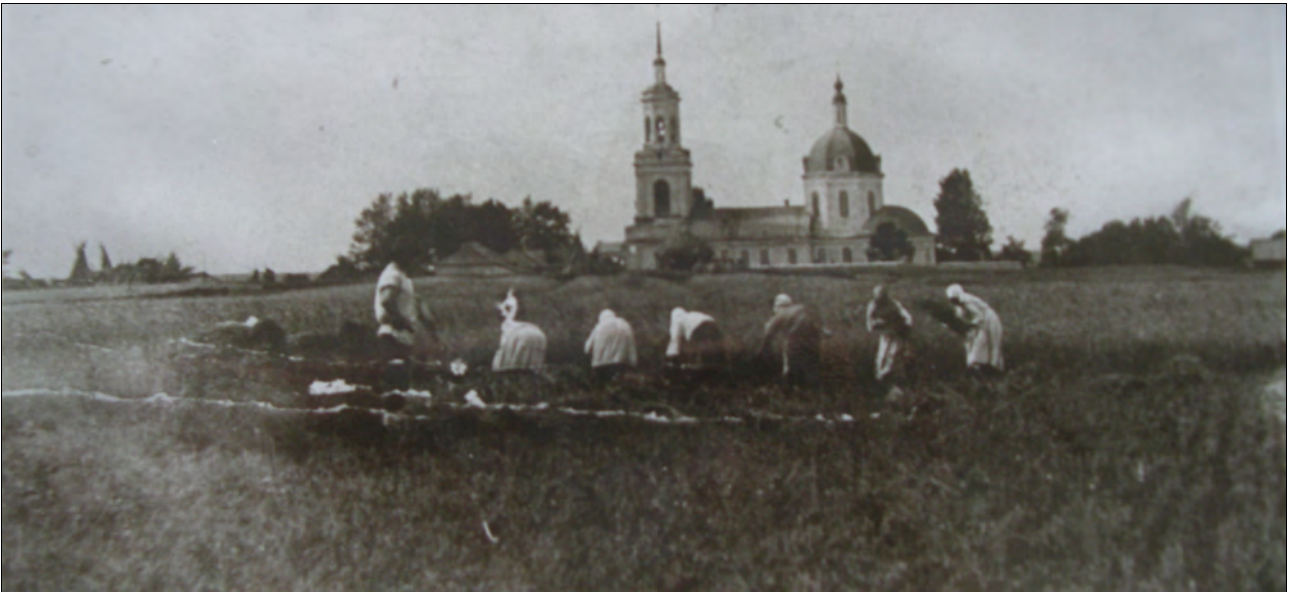
Innhaustingsarbeid ute på dei store markene til kollektivbruket. Me ser kyrkja som landsbyen Veselki høyrte til.