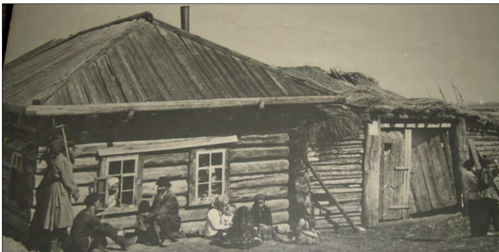
Mange russiske familier levde i svært enkle kår.