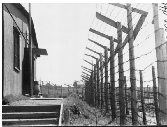
Inngangen til ei av brakkene i leiren på Folkvord.

I Sør-Rogaland var det oppretta fleire fangeleirer. Det var leirar på Moi, i Egersund, på Austvoll, Folkvord og Soma ved Sandnes og så var det ein på Sviland. I tillegg vart det sett opp enkle brakker ute i området kor fangar meir eller mindre måtte klare seg sjølv, under strengaste tysk vakthald, sjølvsagt. Mange augnevitne som såg desse fangane, huskar spesielt avstraffinga. Desse brutale handlingane har etterlete minner for livet. Fangane vart sette til tungt arbeid. Så vart dei hundsa og jaga omkring på byggeplassen. Avstraffinga føregjekk enkelte gonger i form av slag og spark, andre gonger med å måtta legge seg ned på marka og reise seg opp – gong etter gong. Det var hardt for ein svolten og utslitt fange. Og så buforholda; om vinteren i trange, trekkfulle brakker med uisolerte vegger.