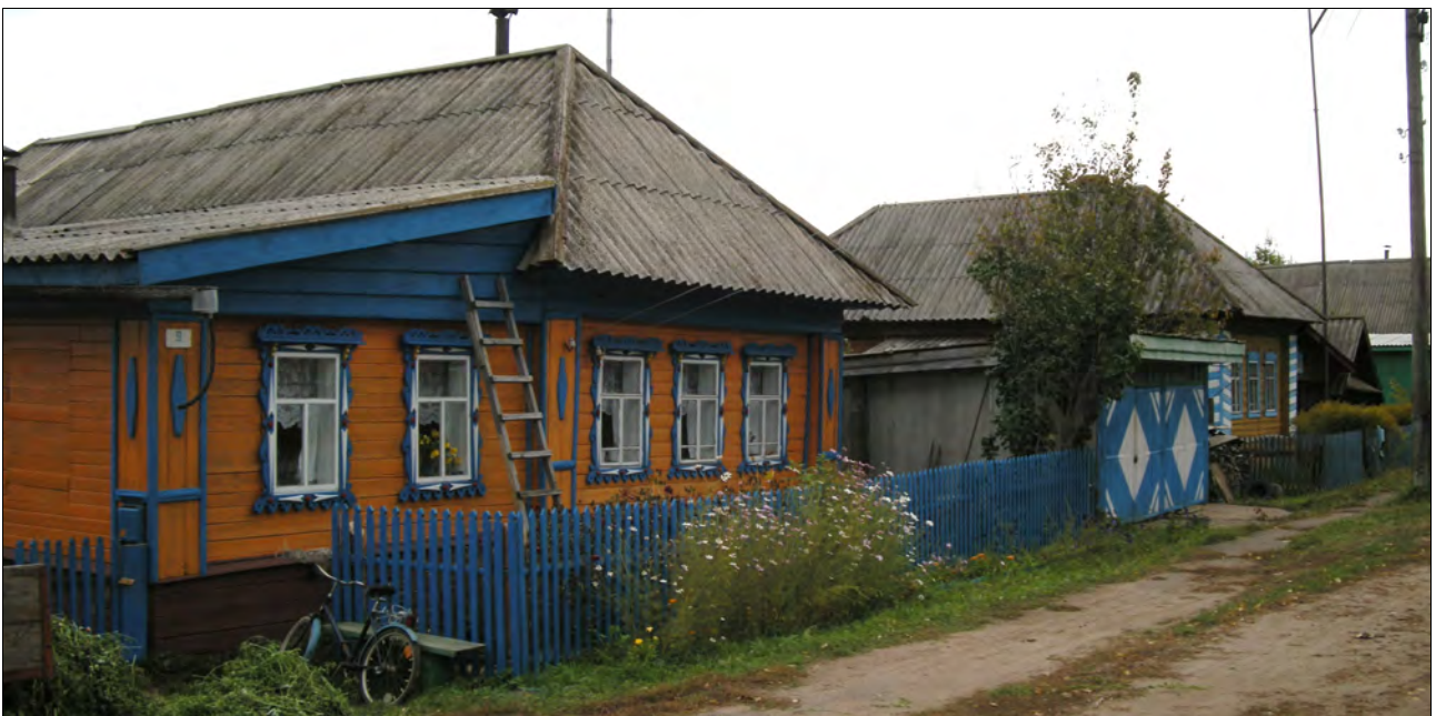
Slike typiske russiske hus ser me ute på landsbygda, også i dag.