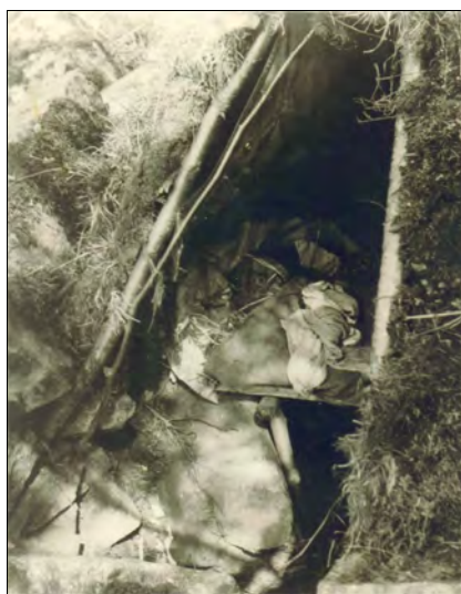
Her ser me «Russerhåla» slik ho var då Arkadij budde her våren 1945.