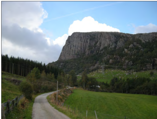
Kyrkjefjellet på Birkeland